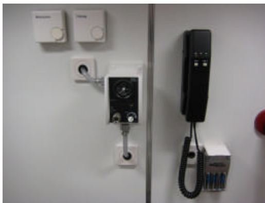
Sauerstoffregelung, Heizung, Funkhörer, Akkuladegerät f. Kamera