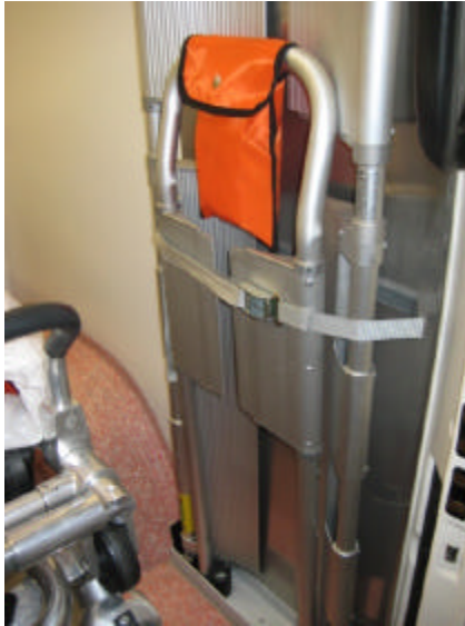
Schaufeltrage mit Befestigungsmaterial

Direkt neben der Tür im Ladebereich ist an der Wand eine Schaufeltrage fixiert. Die dazu gehörige Vakuummatratze liegt auf der Trage.