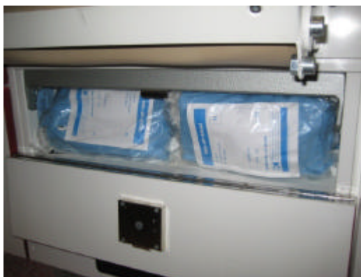
Fach unter dem Sitz

Vor dem Waschbecken ist der Sitz befestigt unter dem sich das letzte Fach befindet, in der sich selten verwendetes Materiel wie ein Steckbecken und eine Urinflasche verstaut ist. In dem Steckbecken selbst ist außerdem eine Rolle Klopapier.