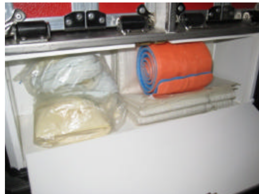
Fach unter den Koffern