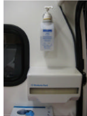
Desinfektionsmittel Papiertücher, Nitrilhandschuhe,

Vor dem Waschbecken ist der Sitz befestigt unter dem sich das letzte Fach befindet, in der sich selten verwendetes Materiel wie ein Steckbecken und eine Urinflasche verstaut ist. In dem Steckbecken selbst ist außerdem eine Rolle Klopapier.