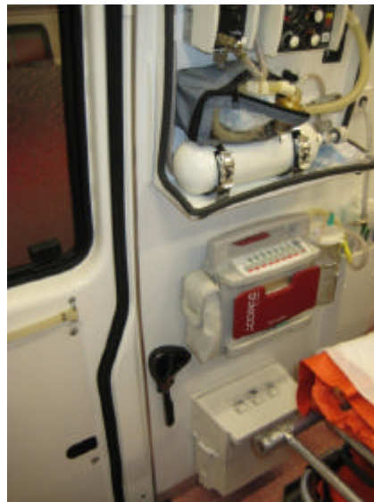
Medumat, Absaugpumpe, Mülleimer, Schere

Direkt neben diesem Schrank befinden sich an der Wand angebracht ein Medumat, eine Absaugpumpe, ein Mülleimer und einige verschiedene Absaugkatheter.