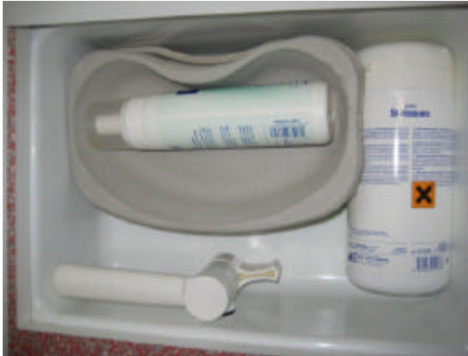
Nierenschalen, Desinfektionsspray, Desinfektionstücher

Im Waschbecken selbst befinden sich Nierenschalen, Desinfektionsspray und eine Packung Desinfektionstücher. Direkt daneben ist eine Packung Nitrilhandschuhe.. Nach getaner Arbeit kann man sich dann die Hände am Spender desinfizieren und sich die Hände abtrocknen.