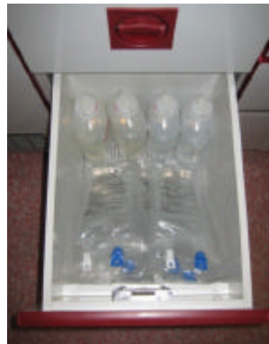
Infusionen in Wärmeschublade