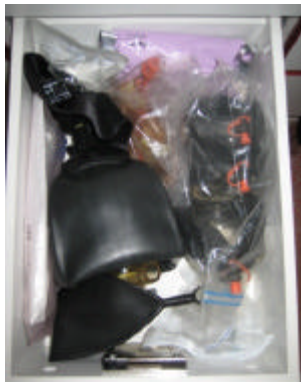
Beatmungsbeutel und Masken

In der zweiten Schublade von unten lagern Tuben und Beatmungsbeutel. Gekühlte Infusionen befinden sich in der letzten Schublade ganz unten.