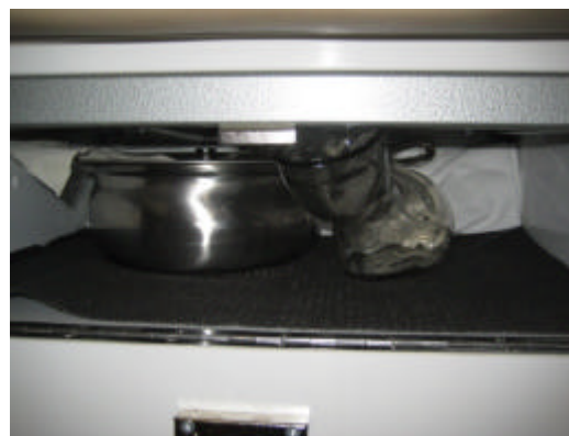
Steckbecken und Urinflasche