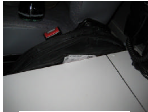
Schneeketten (in Tasche)