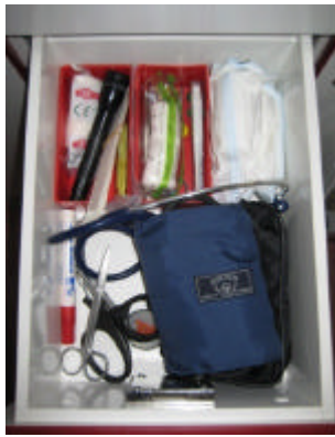
Häufig benutzte Ausrüstung

In der obersten Schublade befindet sich häufig benutzte Ausrüstung wie Blutdruckmanschette oder Verbandpäckchen. Intubationsbesteck und Zubehör findet man eine Schublade tiefer.