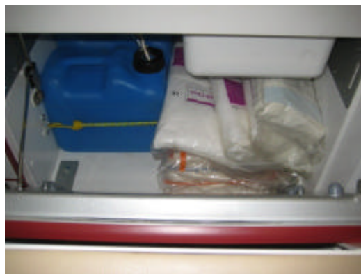
Bereich hinter dem Sitz

Den silbernen Schlüssel benötigt man um den Sitz hervor zu klappen. Hinter dem Sitz befinden sich die außer Betrieb genommene „Wasserversorgung“ des RTWs und nicht häufig benutztes Material.