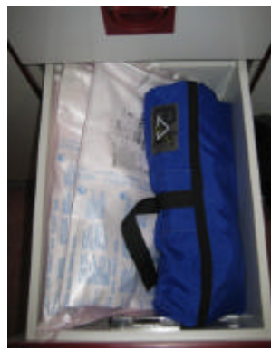
Intubationsbesteck und Tuben

In der zweiten Schublade von unten lagern Tuben und Beatmungsbeutel. Gekühlte Infusionen befinden sich in der letzten Schublade ganz unten.