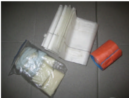
Samsplint, Tragetuch, Fixierbinden

Hier sind die roten Notfallkoffer sicher während der Fahrt befestigt. Von Innen sind sie in dieser Zeit nicht erreichbar! In dem kleinen Fach darunter befinden sich eine Samsplint Schiene, ein Tragetuch und Fixierbinden.